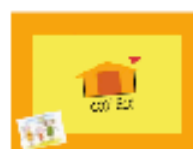
Eco Cooperativa Sociale